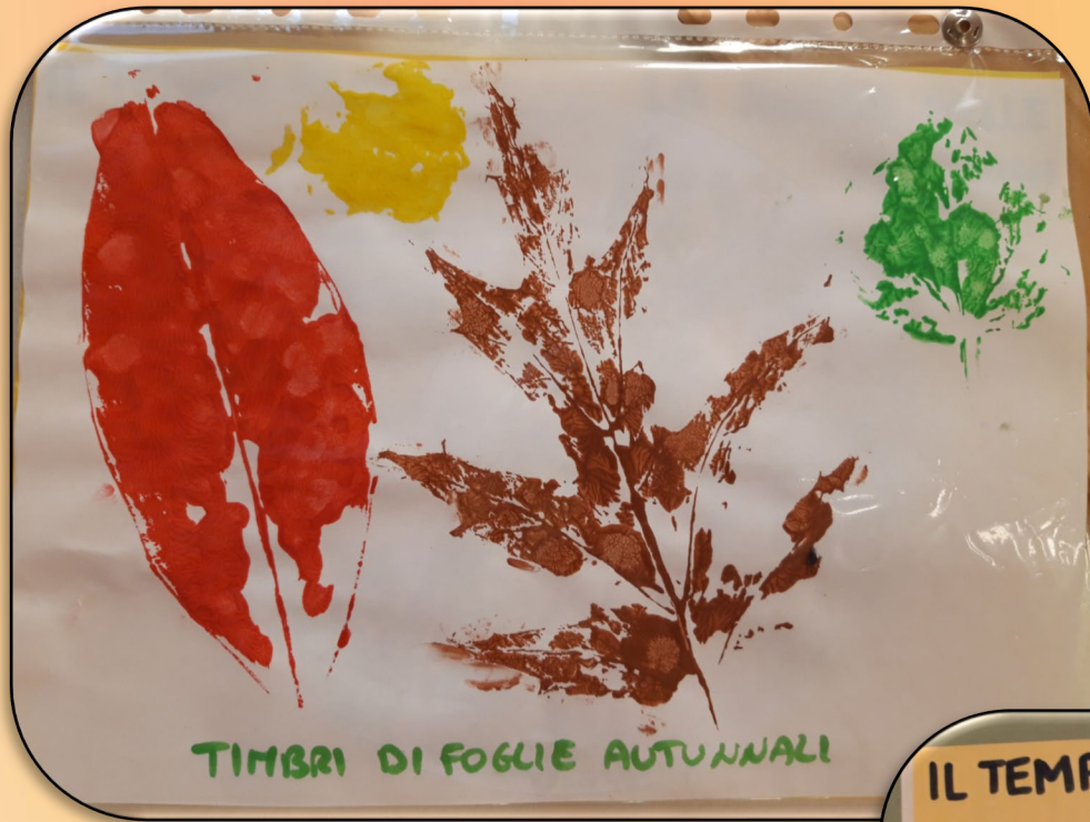
TIMBRI DI FOGLIE AUTUNNALI